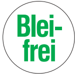
PB8 Ø 19 mm (Originalgröße)