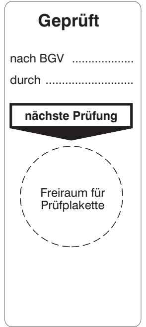
Grundplakette Prüfung gemäß § ... nächste/letzte GP1