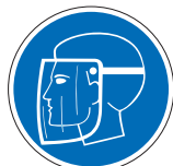
Gesichtsschutz benutzen M08