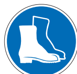
Fußschutz benutzen M05