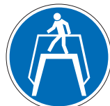
Übergang benutzen M12