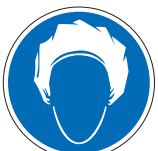
Kopfschutzhülse tragen M21