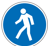
Für Fußgänger M10