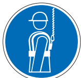
Auffanggurt benutzen M09