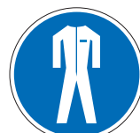
Schutzkleidung benutzen M07