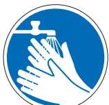
Hände waschen M22