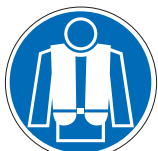
Rettungsweste benutzen M15