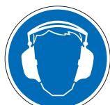
Gehörschutz benutzen M03