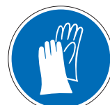
Handschutz benutzen M06