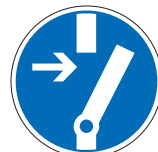
Vor Arbeiten freischalten M14