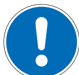
Allgemeines Gebotszeichen M00