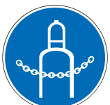
Druckgasflasche durch Kette sichern M20