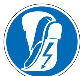
Leitfähiges Schuhwerk tragen M23