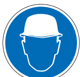
Schutzhelm benutzen M02