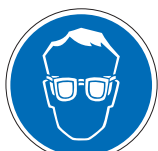
Augenschutz benutzen M01