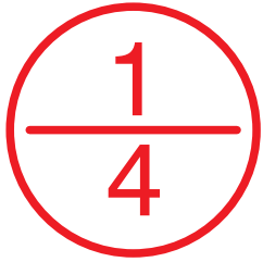
614K30 (nur in Ø 30 mm)